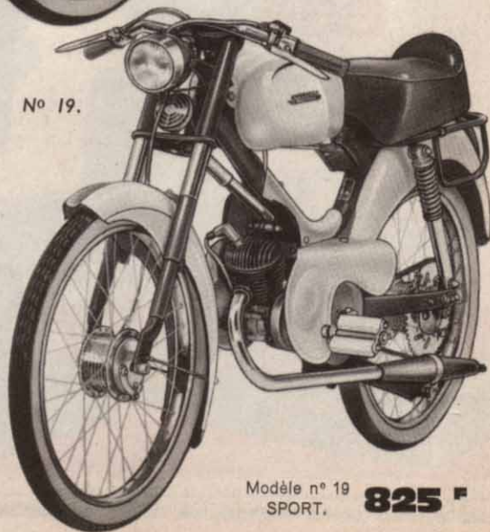
Modèle n° 19 SPORT. 825 F

Adresser les commandes à MANUFANCE, ST-ÉTIENNE (Loire) , ou acheter direct. à nos magasins de PARIS et PROVINCE.