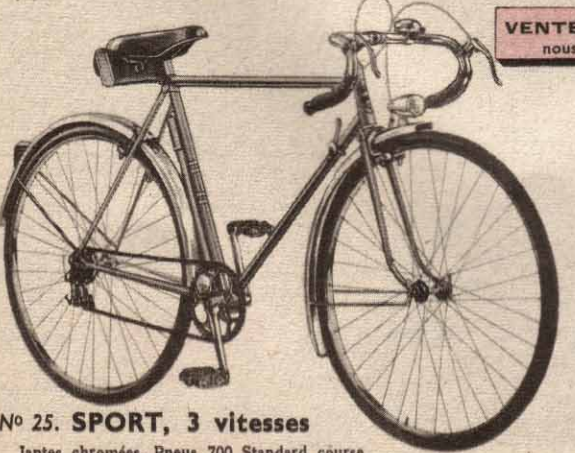
N° 25. SPORT, 3 vitesses

Cadre berceau de même forme que le n° 335 B. Par ailleurs, même description que n° 13 Prix 18.500 F ci-dessus.