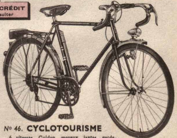
N° 46. CYCLOTOURISME

Modèle conforme à la gravure ci-dessus. Par ailleurs, même description que n° 33 ci-dessus. Prix 22.300 F