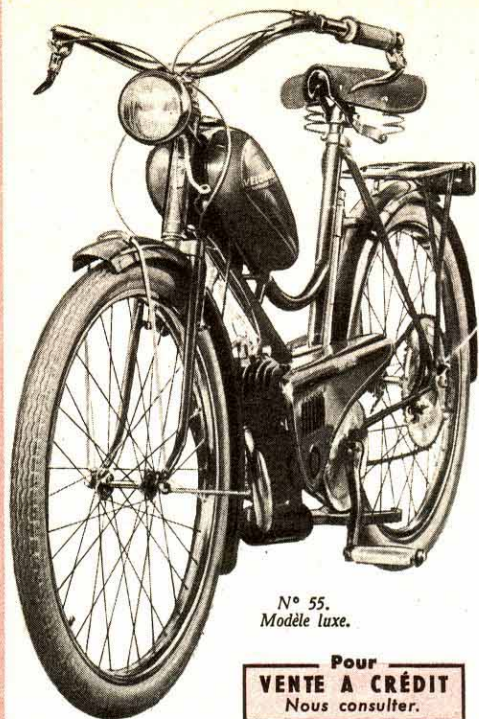
N° 55. Modèle luxe.