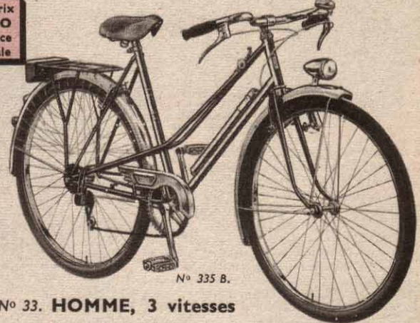
N° 335 B.