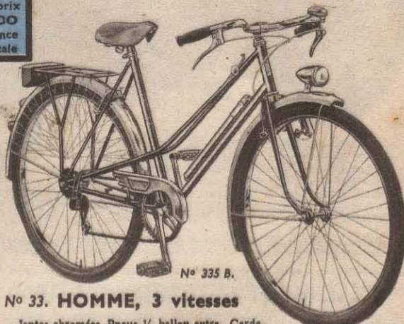
N° 335 B.