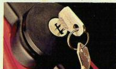
Serbatoio con chiave.

E il tappo del serbatoio (da 4 litri) con la chiave per non avere imprevisti di altro genere.