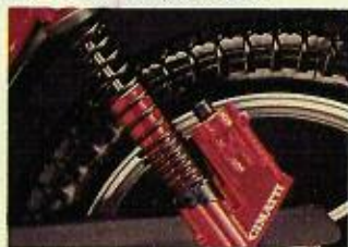
Ammortizzatore a gas.

La forcella idraulica in alluminio e gli ammortizzatori a gas per affrontare non solo la