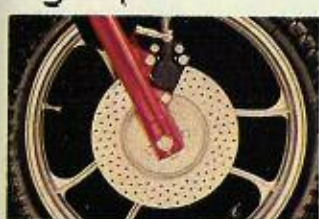
Freno a disco.